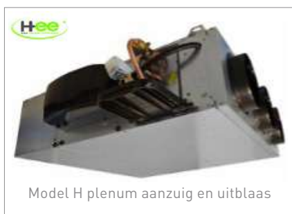
Model H plenum aanzuig en uitblaas